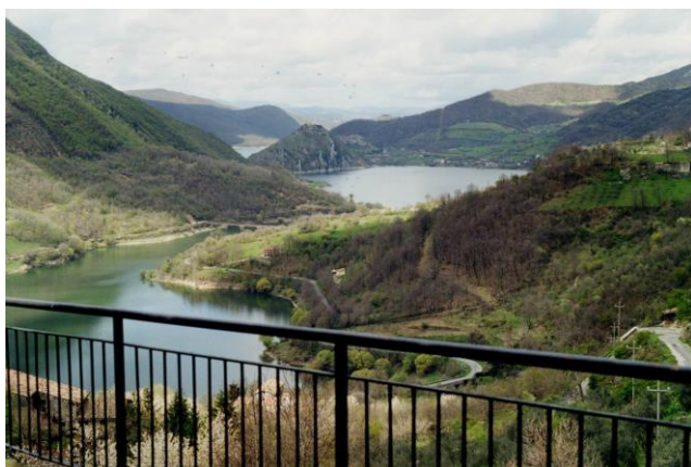
Lago del Turano, Castel di Tora